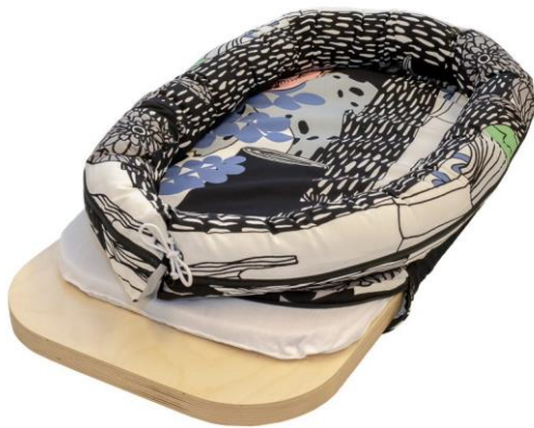
KUVA 1. Nucun-alusta

Opinnäytetyön tavoitteena oli tuottaa järjestelmä Nucun valmistamien Nucun-hyvinvointialustojen (kuva 1) päivittämiseen ja tehdas-asennukseen. Järjestelmään kuuluu myös verkkoratkaisu, joiden avulla yksittäisten laitteiden tietoja voidaan tallentaa ja tarkkailla. Opinnäytetyössä tekijän vastuualueina olivat palvelin- ja web-sovelluksen kehitys.